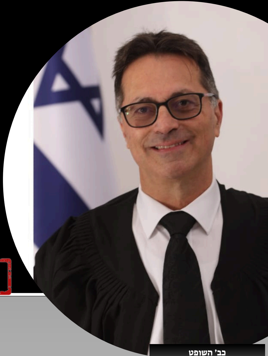
כב' השופט משה בראון