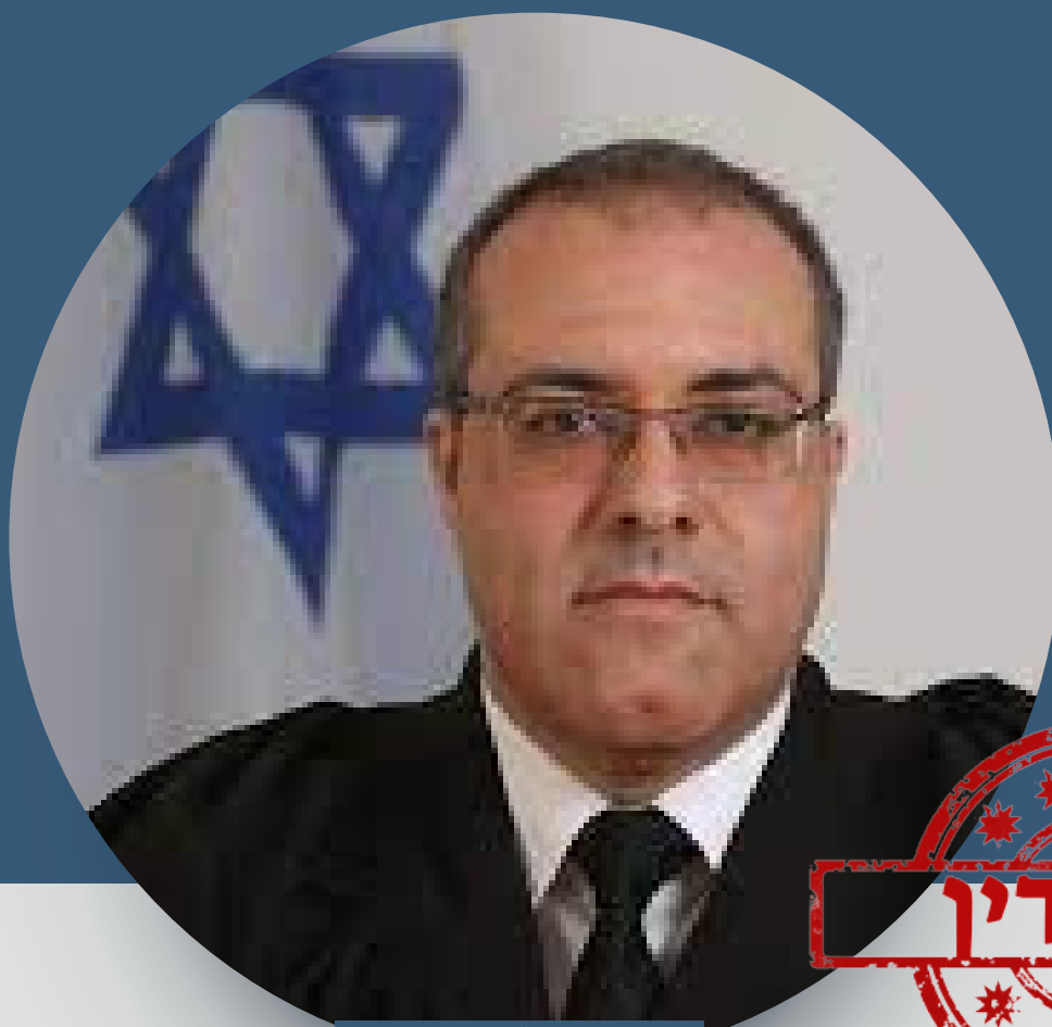
כב' השופט סארי ג'יוסי