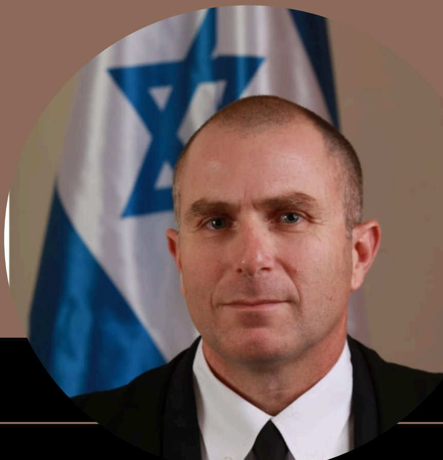
כב' השופט טל פפרני